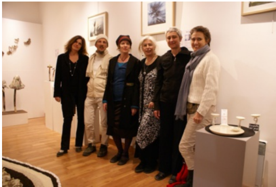
Graines de talent à découvrir espace des Capucins, dans Noir sur blanc, l'exposition inspirée par le truffe noire

L'Office municipal de la culture d'Uzès regroupe des artistes céramistes de talents pour une exposition inédite : "Noir sur blanc" ! Venez découvrir ce moment qui a démarré un peu avant le week-end de la truffe à la galerie des Capucins d'Uzès à côté de l'office de tourisme. Exposition visible jusqu'au dimanche 25 janvier 2015.